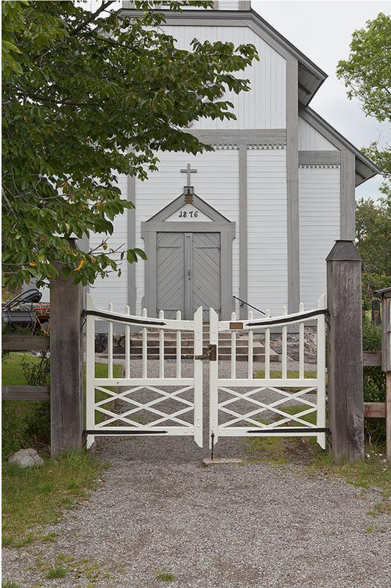
Kyrkogårdens enda grind. Bild 150