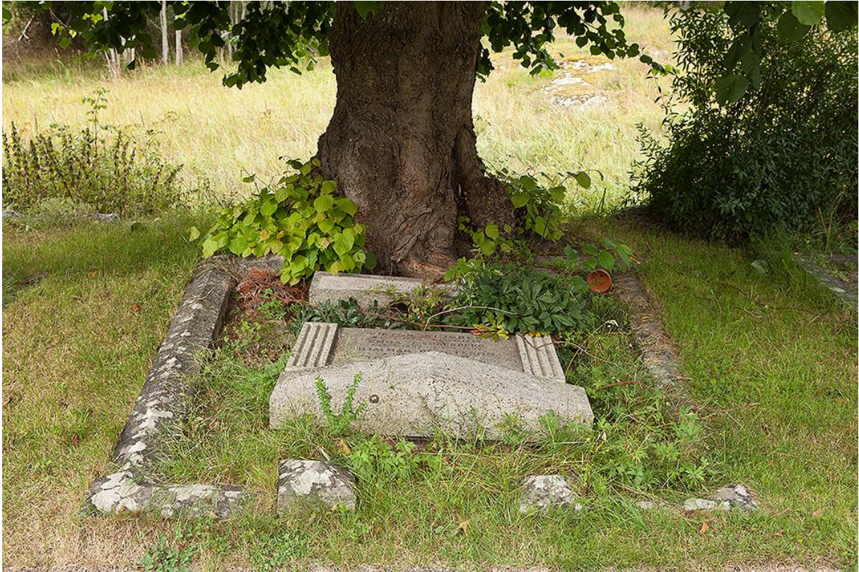
Exempel på stenkantad gravvård som lagts ner pga rasrisken. Bild 123