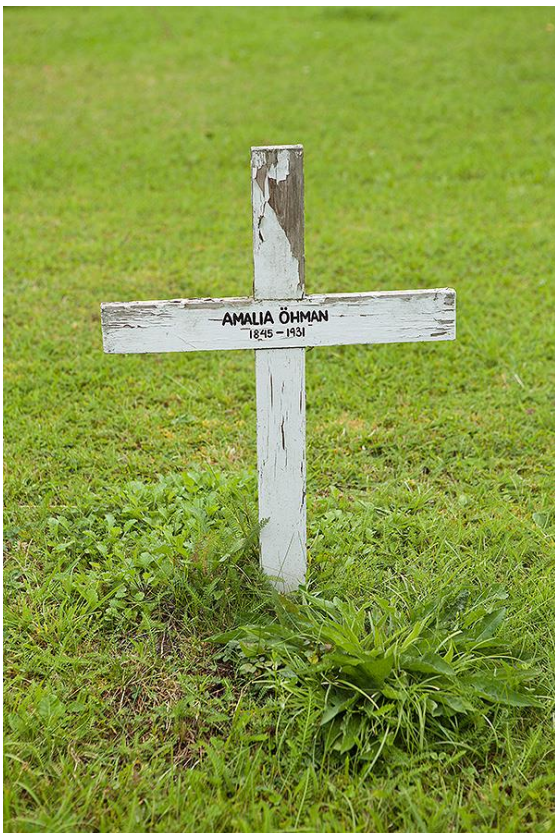
Exempel på enkelt träkors som tidigare dominerade kyrkogården. Bild 128