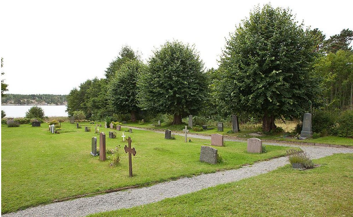
Här syns de hamlade lindarna på rad läng kyrkogårdens västra sida. Bild 18

En ligusterhäck återfinns även på kyrkogårdens östra sida. På grannfastigheten öster om kyrkan står ett flertal askar och almar.