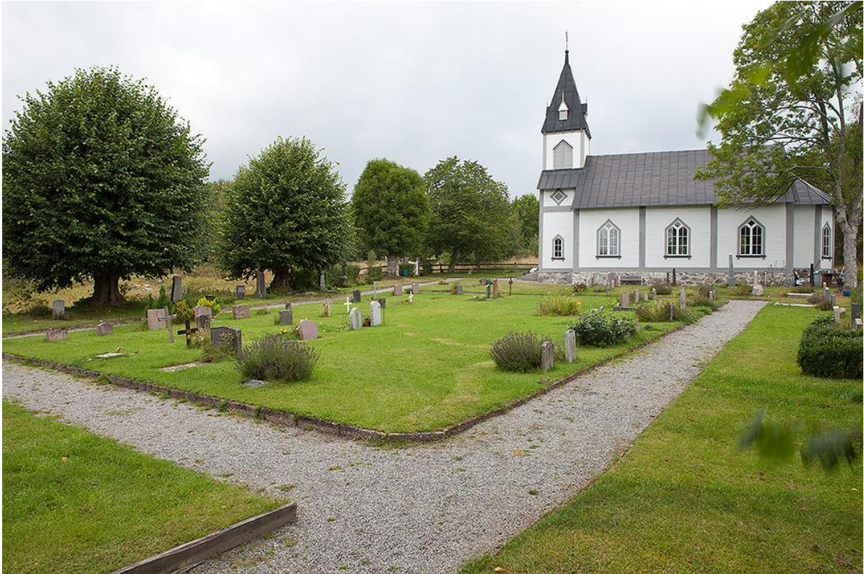
Det dominerande centrala kvarteret omgivet av den stenkantade grusgången. Bild 44