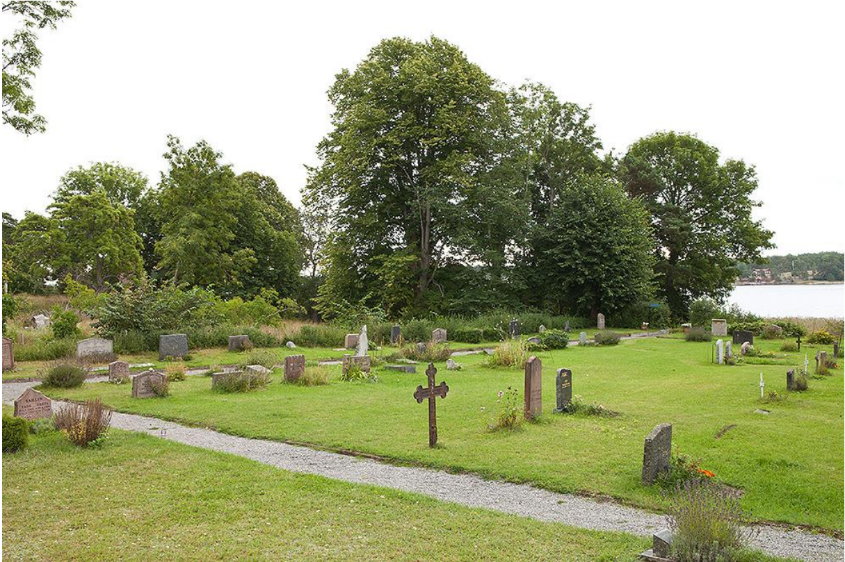
Kyrkogården med utblick mot vattnet. Bild 27

Kyrkogården omfattar endast fyra kvarter av varierad storlek och form. Kvarteren är gräsbevuxna och separeras av en grusad gång som löper från stigluckan i väster runt det dominerande kvarteret i mitten av kyrkogården och vidare ner till kvarteret för urngravar samt minneslunden. Grusgången kantas av betongsten med frilagd ballast.