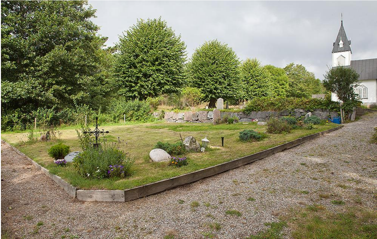
Kvarteret för urngravar som ianspråktoqs 1992. Här syns även den äldre terrassmuren som avgränsade den ursprungliga kyrkogården. Bild 60