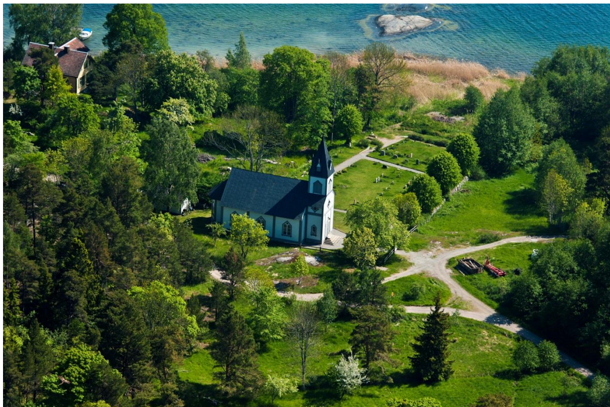
Nämdö kyrkogård sedd från ovan. Stockholm stift, bild nr 11053113.

Djurö, Möja och Nämdö församling, Värmdö kontrakt, Stockholms stift Västerby 5:325, Nämdö socken, Värmdö kommun Stockholms län Södermanland