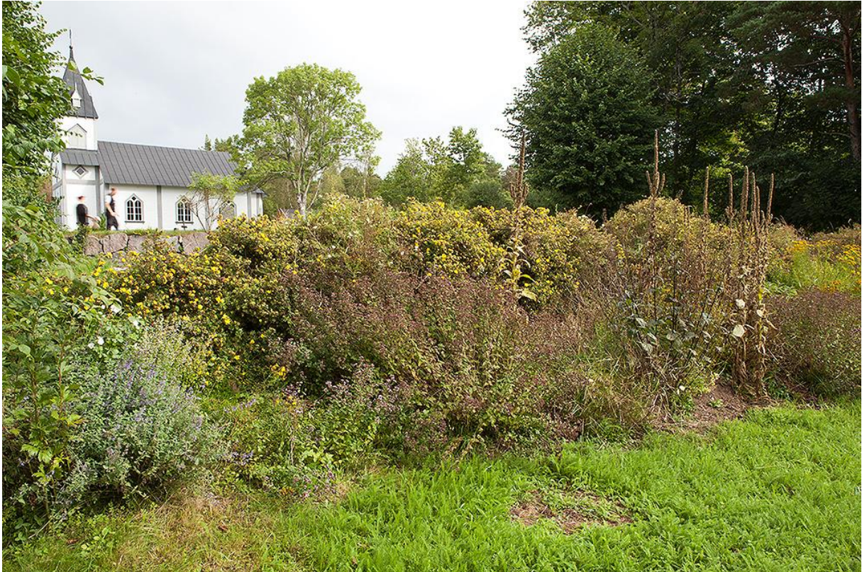
Del av minneslunden med sin avskärmande växtlighet. Bild 74